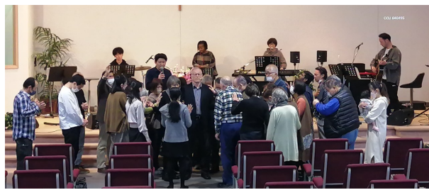
ケイラーファミリーのために共に祈りください。 神様の慰めと平安がありますように。