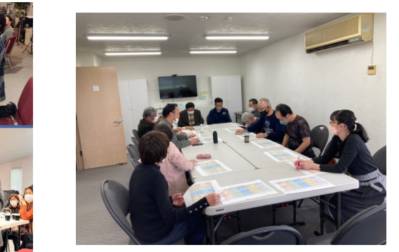
3/12 フードバンク説明会 共に祈りつつ、前進していきましょう!